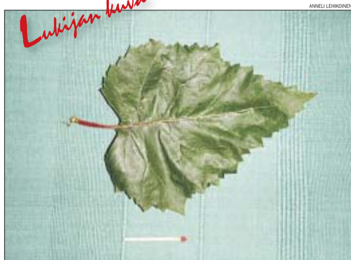
Kesän komein koivunlehti?